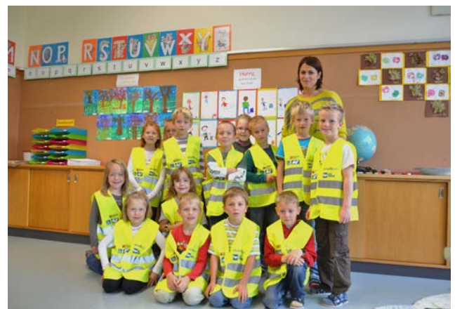
Der OÖ. Zivilschutz verteilt zu Schulbeginn Warnwesten an die Schulanfänger